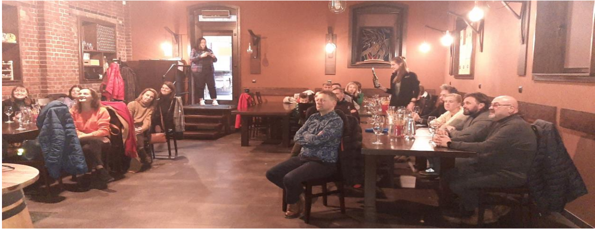
Diskuze o přípravě animované kuchařky